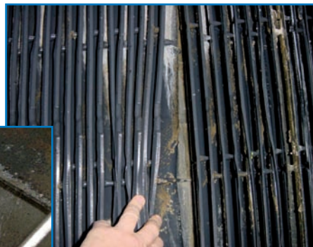
Presencia de biopelícula