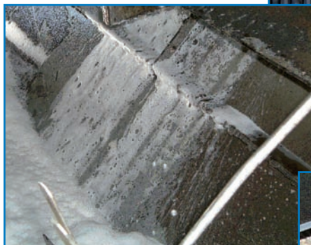
Circulación de una solución detergente

Nota 5 : ¡¡¡Único !!! Estas operaciones de desinfección efectuadas por el personal BAC Balticare son combinadas con un mantenimiento mecánico de las torres de enfriamiento, con un abastecimiento de un informe detallado de estado de los equipos, según exige el RD 865/2003.