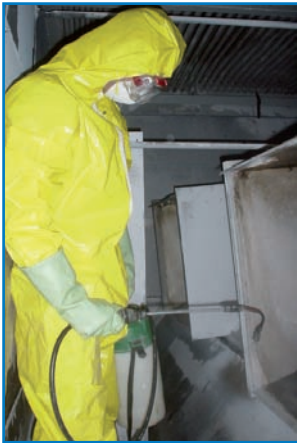
Operación de limpieza

Nota 1 : La limpieza mecánica de la torre, la balsa, la pulverización, las partes accesibles de la superficie, es efectuada dos veces al año según los procedimientos indicados. Conforme a las nuevas órdenes de aplicación para las instalaciones de enfriamiento que engloba el RD 865/2003, la operación de limpieza mecánica de las partes accesibles es el complemento de una limpieza química.