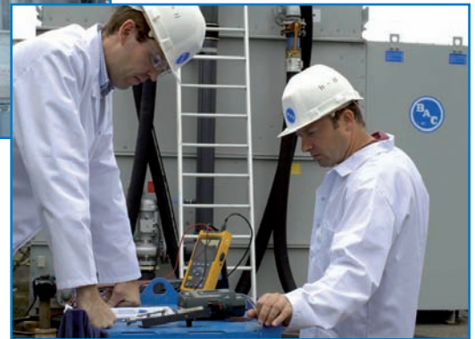
Operación de desincrustación